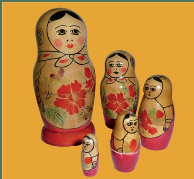
L'identità è una "matrioska".

Principali temi trattati. Come si acquisisce un'identità in ambienti culturali e geografici diversi? Come si diventa italiani? Sono prese in esame legislazioni vigenti in diversi contesti culturali. Quali sono i rapporti tra moda e ostentazione dell'identità personale?