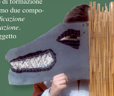
Maschere in gioco nel laboratorio della mostra.

Principali temi trattati. Classificazione e genere nelle scienze naturali e sociali. Differenze tra sesso e genere. Rapporto tra il sesso e l'immagine di genere in diversi contesti socio-culturali.